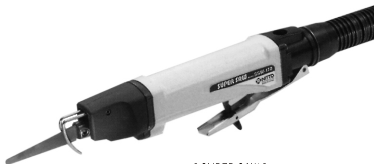
●SUPER SAW● SSW-110型