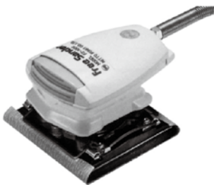
●は人用研磨用● FS-100C 型