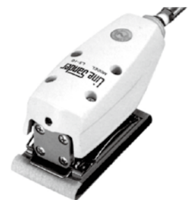
●小型研磨用● LS-10 型