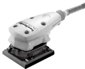
●精密研磨用● FS-50A 型